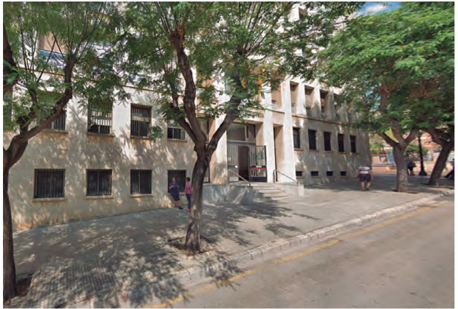
L'accés als Jutjats de Tarragona és un clar exemple de barreres arquitectòniques.

se desenvolupament molt de temps i això no facilita les coses. Nosaltres, parlo de companys de Barcelona però també de Tarragona, hem treballat amb el govern per poder donar cos a aquest desenvolupament però ha costat moltíssim perquè hi ha hagut molts canvis de govern i situacions complexes que no han afavorit que això sortís. Imagino que en moltes ocasions s'han trobat en situacions en què han pensat que això, per a ells, no era el prioritari mentre nosaltres, fins que això no es publiqui, estem en una situació de desavantatge molt significativa. Si anem a la llei anterior, s'estan acceptant com a bones certes situacions que realment no faciliten l'accessibilitat i, per tant, com anem a remolc és del tot necessari que es canviï la situació legal.