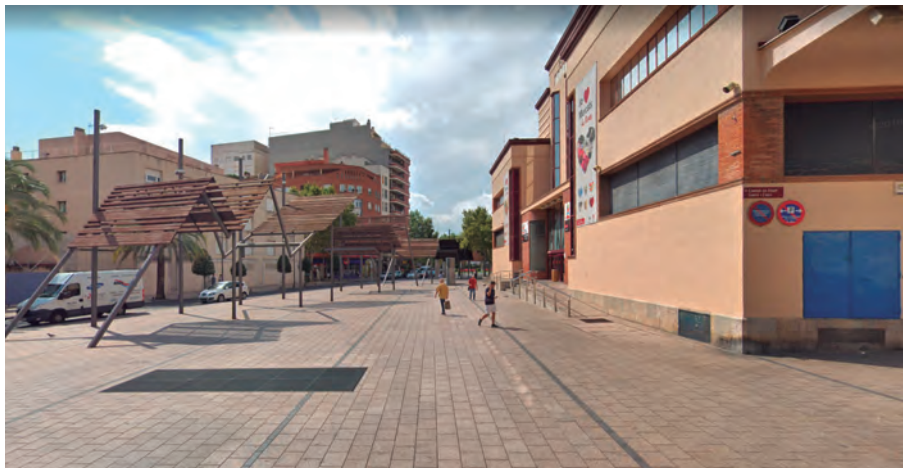
El Mercat Central de Reus presenta deficiències importants d'accessibilitat, com la inexistència de bandes a les escales d'accés o de semàfors adaptats a la rotonda que porta a l'edifici.

Amb els espais públics ja hi hauries de pensar, no caldria que l'ONCE o altres entitats t'ho haguessin de demanar. Quan trobem punts difícils de superar els comuniquem a l'ajuntament però els criteris que tenen els tècnics municipals amb les necessitats de la vida real, no sempre coincideixen. Et pots trobar encaminaments al terra que no marquen