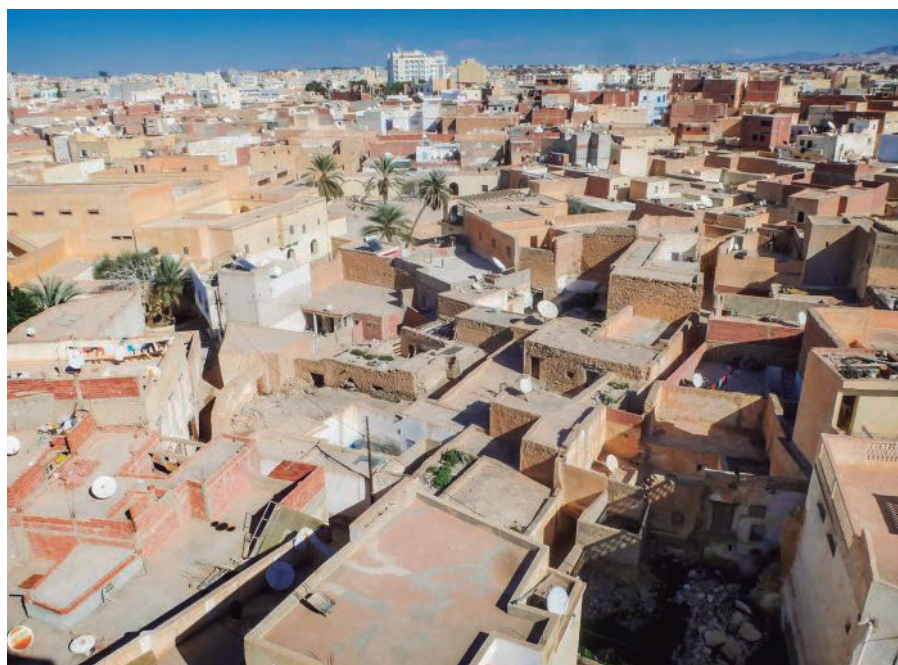
Rehabimed ha fet l'assessorament internacional per revitalitzar la Medina de Gafsa, a Tunísia

La regeneració urbana la pot proposar qui vulgui, des del Cap dels Serveis d'Arquitectura de l'Ajuntament de Tarragona a un aparellador, però sempre haurà de ser l'administració la qui es posi al capdavant.