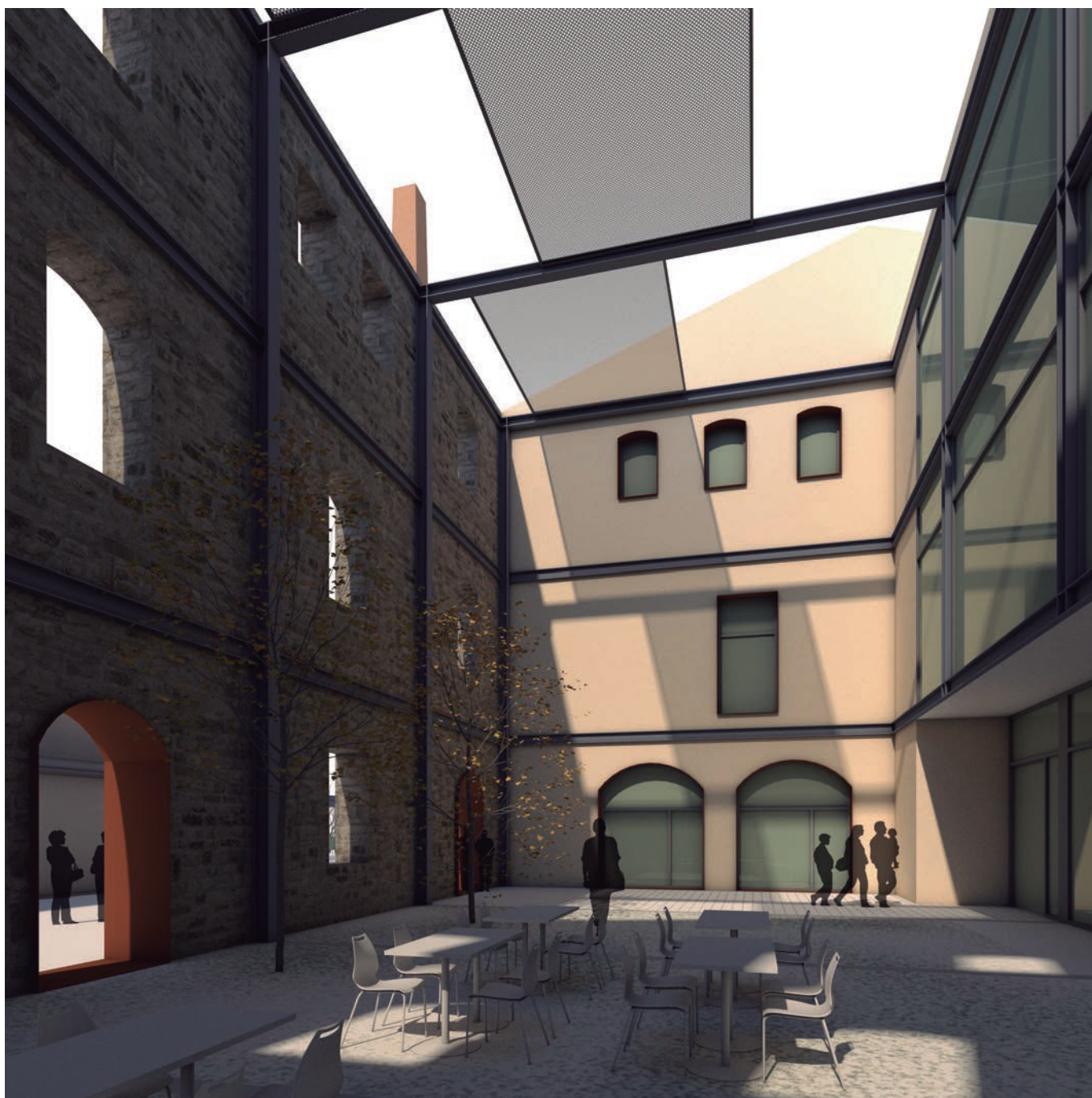
El projecte inclou la recuperació de part dels edificis com a espais compartits. La imatge mostra el pati interior de co-working.

Sostre Cívic i nosaltres hem fet una aliança amb ells. D'aquesta manera s'han convertit amb els nostres partners perquè ells són l'entitat jurídica que, si tot va bé, adquirirà la fàbrica del Catllar aquest mes de setembre. Ells s'hipotecaran, transmetran els drets als seus socis i nosaltres serem els impulsors-consultors d'aquesta iniciativa. De moment, ja hem cedit els nostres drets a Sostre Cívic, amb tot un seguit de condicionants perquè farem els projectes i els muntatges, deixant a les seves mans, com cooperativa sense ànim de lucre que és, la propietat.