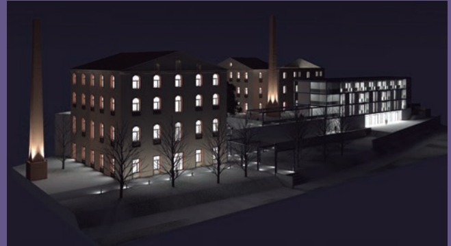
Imatge simulada de la fàbrica del Catllar ja enllestida.

Com a ideòlegs d'aquest projecte del Catllar, defensen que té un benefici per a la societat i per al poble perquè el municipi recupera un espai històric en desús i es posa a