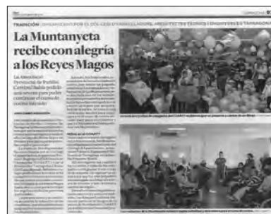
Diari de Tarragona. Dimarts, 7 de gener de 2014. "La Muntanyeta recibe con alegría a los Reyes Magos"

Tarragona21 ( www.tarragona21.com ). Dimecres, 8 de gener de 2014. "Els Reis arriben a 'La Muntanyeta' de mà del COAATT i la Fundació Tarragona Unida"