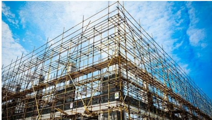
Imatge d'un edifici en construcció

Sota el lema 'Tornarem a construir', els col·legis d'aparelladors catalans inicien una campanya perquè puguin refer-se de les pèrdues