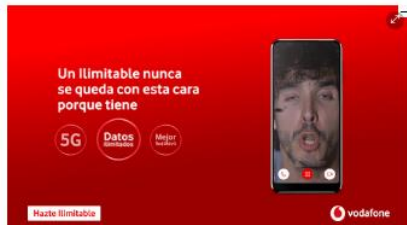
Obreros en la rehabilitación de unos locales en un edificio de Salou. Los trabajos se han reanudado esta semana.