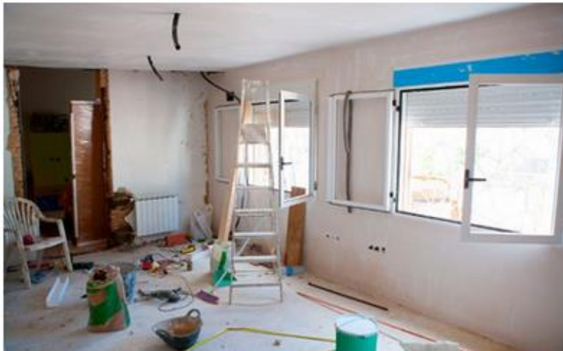
Amb la Fase 2, s'han pogut reprendre també les obres de rehabilitació

En el sector de la rehabilitació, la caiguda a la demarcació ha estat més sostinguda, d'un 40% al maig