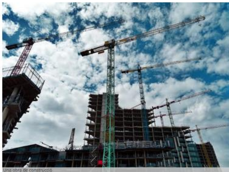
Una obra de construcció