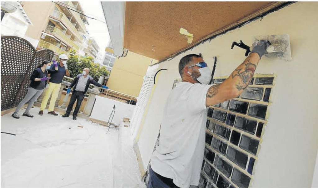
Obreros en la rehabilitación de unos locales en un edificio de Salou. Los trabajos se han reanudado esta semana.