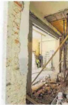
Imatge d'arxiu d'unes obres.

Un dels requisits més importants per a demanar les ajudes és que aquells edificis pels quals es demanin han de disposar de l'informe d'avaluació de l'edifici (IAE), tenir passada la Inspecció Tècnica d'Edificis (ITE) i el Certificat d'Eficiència Energètica (CEE) amb la corresponent etiqueta de qualificació. En aquest sentit, des del COAATT es recorda que existeix el portal www.obresambgarantia.com on els propietaris poden sol·licitar que un tècnic qualificat els faci aquestes certificacions a més de saber, de manera imprescindible, si el seu habitatge es pot acollir a les ajudes a la rehabilitació o no. En aquest ma-