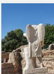
La vil·la dels Munts és un dels espais protagonistes del llibre publicat pels col·legis d'aparelladors i arquitectes.

per evidenciar, a les pàgines del llibre dedicades a Tarragona, la importància del llegat de la ciutat. La redacció del text ha anat a càrrec del periodista Òscar Ramírez Dolcet, responsable del departament de Comunicació del COAATT.