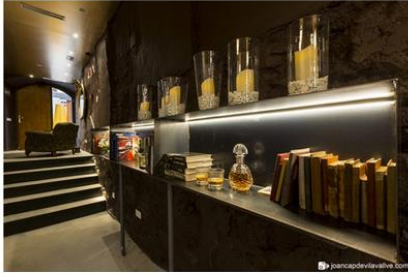
Fotografia de l'Hotel Secrets a Falset

En aquest article publicat a la revista TAG' del Col·legi d'Arquitectes Tècnica i Enginyers d'Edificació de Tarragona (COAAT), descobrirem com una casa del 1829 situada al bell mig del centre de Falset ha esdevingut Hotel Secrets