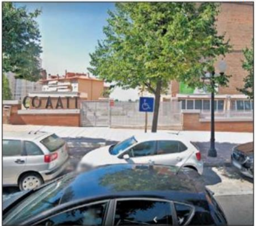
La seu del col·legi es troba a la Rambla President Macià.

Amb tot, però, segons el col·legi el COAATT ha aguantat aquests anys durs de recuperació lenta consolidant les feines realitzades, defensant als seus col·legiats, oferint la millor cara davant del futur i cercant nous àmbits laborals on els seus pro-