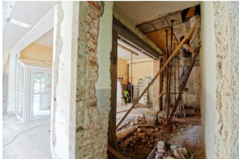
El 4 d'octubre finalitza el termini per demanar ajuda a la rehabilitació d'edificis residencials i per les obres d'habitatges per a gent gran

El 4 d'octubre també finalitza el termini per sol·licitar ajudes per les obres d'habitatges per a gent gran