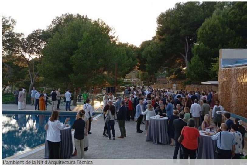
L'ambient de la Nit d'Arquitectura Tècnica Cedida

Més de 180 persones han assistit a la tradicional Nit de l'Arquitectura Tècnica, organitzada pel Col·legi Oficial d'Aparelladors, Arquitectes Tècnics i Enginyers d'Edificació de Tarragona (COAATT), que enguany ha tingut lloc a l'Infinitum Beach Club de Salou. Aquest acte és un punt de trobada d'homenatge als arquitectes tècnics que celebren els seus 50 i 25 anys de professió aquest any, així com una benvinguda als nous col·legiats i col·legiades que s'han unit al COAATT durant el darrer any. Els homenatjats han rebut un reconeixement especial pel seu compromís i dedicació al llarg dels anys, marcant mig segle o un quart de segle de contribucions significatives al camp de la construcció i el disseny. Enguany, un sol col·legiat celebrava els seus 50 anys de professió, mentre una quinzena han celebrat els seus primers 25 anys.