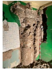
Capitell descobert darrera de l'envà de la cuina

Amb tota aquesta informació vam realitzar un informe arqueològic i vam modificar el projecte per no afectar les restes i posar en valor els principals elements. D'aquesta forma els baixos es van unir en un duplex amb els primers, de forma que es crearia un doble espai que permetria deixar vistes les dues columnes des del nivell de planta baixa fins al nostre de planta primera, així mateix.