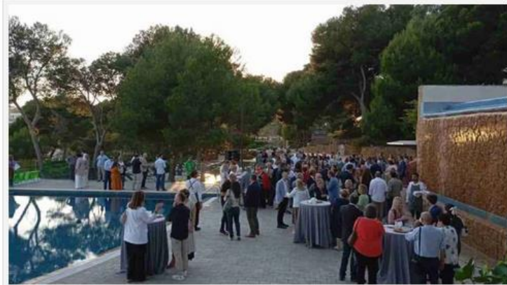
Un dels moments de la Nit de l'Arquitectura Tècnica.

Més de 180 persones han assistit a la tradicional Nit de l'Arquitectura Tècnica, organitzada pel Col·legi Oficial d'Aparelladors, Arquitectes Tècnics i Enginyers d'Edificació de Tarragona (COAATT), que enguany ha tingut lloc a l'Infinium Beach Club de Salou. Aquest acte és un punt de trobada d'homenatge als arquitectes tècnics que celebren els seus 50 i 25 anys de professió aquest any, així com una benvinguda als nous col·legiats i col·legiades que s'han unit al COAATT durant el darrer any. Els homenatjats han rebut un reconeixement especial pel seu compromís i dedicació al llarg dels anys, marcant mig segle o un quart de segle de contribucions significatives al camp de la construcció i el disseny. Enguany, un sol col·legiat celebrava els seus 50 anys de professió, mentre una quinzena han celebrat els seus primers 25 anys.