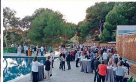
Imatges d'assistents a la tradicional Nit de l'Arquitectura Tècnica que es va celebrar a l'Infinitum Beach Club de Salou. COAATT