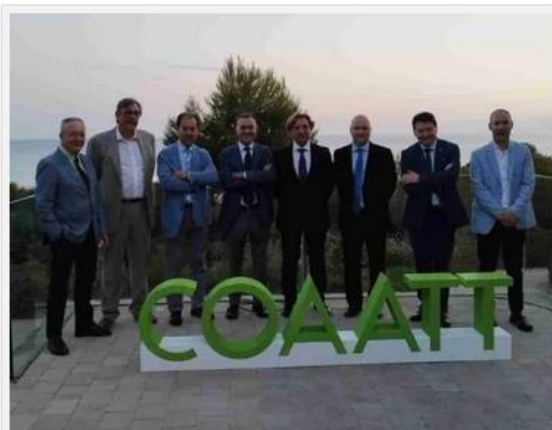
Foto dels presidents dels diversos Col·legis i del president del CGATE.

Un altre dels moments especials de la nit ha estat l'acte simbòlic de benvinguda als nous col·legiats. Seguint la tradició, s'ha fet entrega del casc de obra del COAATT als nous professionals, en aquets cas han estat sis, simbolitzant el seu compromís amb la professió i el seu futur en l'àmbit de l'arquitectura tècnica. Aquest gest no només representa l'inici d'una nova etapa professional per als recent incorporats, sinó també la continuïtat de l'excel·lència i la dedicació.