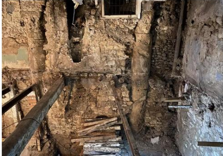
Columnes descobertes en una casa de la Part Alta de Tarragona.

La intervenció arqueològica en una casa de la Part Alta va treure a la llum dues columnes romanes, que podrien ser les més antigues que es conserven a les comarques tarragonines i que haurien estat reaprofitades en una basílica visigoda dels segles V o VI