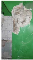
Capitell darrera de l'envà de la cuina

Això sí, la intervenció arqueològica va posar al descobert meravelles, en un primer moment vam sortir un munt d'elements molt moderns, sobretot desguassos en desús i nivells de recol·liment d'una amb un paviment de còdols. Però a les parets de la mitgera vam poder treure a la llum dues columnes d'origen romà, que estaven amagades per un alicat, i que ara sabem que estan reaprofitades en un edifici posterior, possiblement visgot, i que molts identifiquem com una basílica. Aquestes columnes, de ser així, pertanyrien a una església visigoda dels segles V o VI, i per tant serien les més antigues que es conserven in situ a tota la demarcació de Tarragona. A més sobre aquestes encara vam sortir els arcs que subjectaven les columnes, en total més de 9 metres d'alçada conservats d'un edifici de fa uns 1.500 anys. Posteriorment escavarem més en el subsòl, més per fer càlculs que per necessitats de projecte, al cap i a la fi, si no es feia ara que es rehabilitava tot l'edifici potser tindrien que passar 300 anys fins que es pogués tornar a fer una excavació així al lloc, vam poder trobar les bases de les columnes i el paviment de l'església. Finalment també vam poder veure que el nucli d'escaleres es recolza sobre una cisterna d'aigua de gran dimensions.