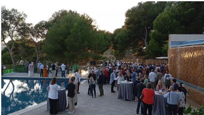
Més de 180 persones van assistir a la tradicional Nit de l'Arquitectura Tècnica, organitzada pel COAATT

Un punt de trobada d'homenatge als arquitectes tècnics que celebren 50 i 25 anys de professió, així com una benvinguda als nous col·legiats