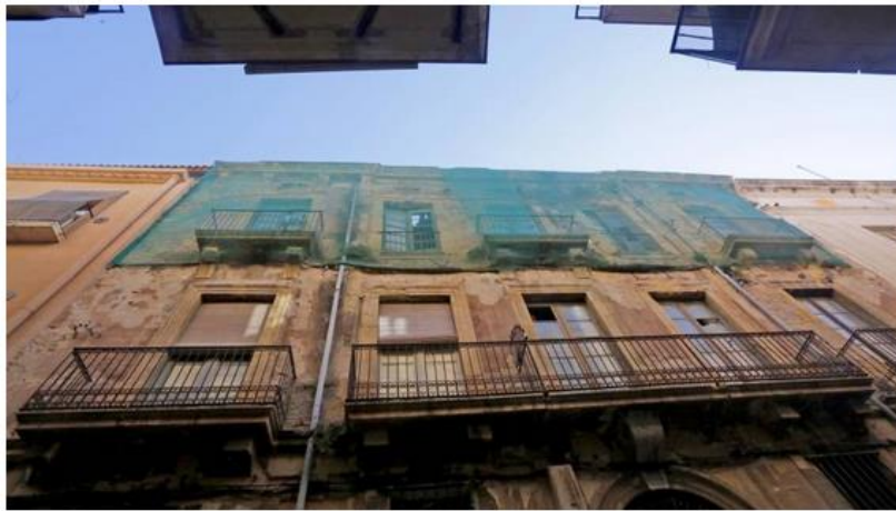
El 93% de los edificios inspeccionados presentaron deficiencias.

06 mayo 2024 17:49 | Actualizado a 06 mayo 2024 17:59