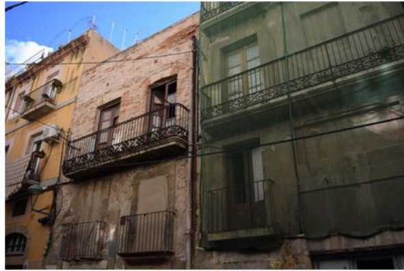
Imatge d'arxiu d'edificis del carrer Lleó de Tarragona.