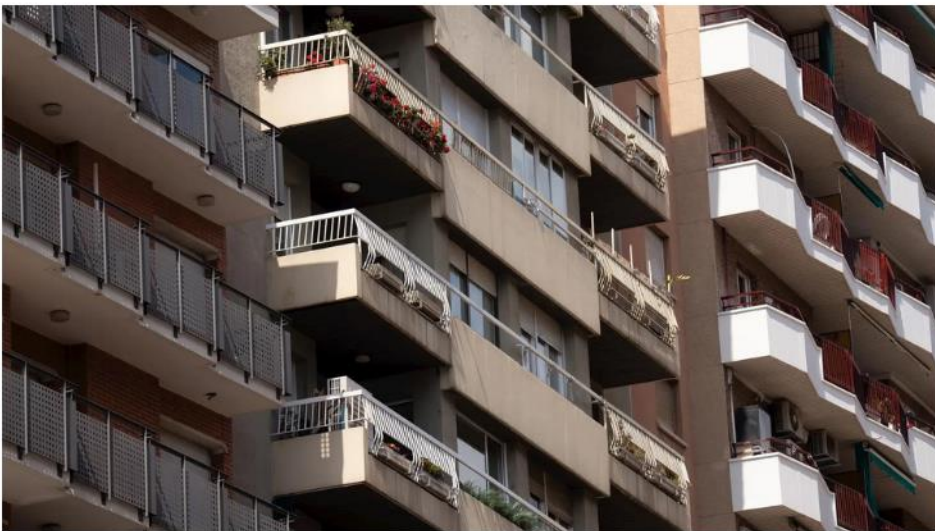
Fachada de un edificio

El Col·legi d'Aparelladors, Arquitectes Tècnics i Enginyers d'Edificació de Tarragona ha alertat que un 80% dels edificis del Camp de Tarragona que haurien d'haver passat la Inspecció Tècnica d'Edificis no ho han fet. Segons les estimacions del col·legi, des que va entrar en vigor el decret que regula les ITE el 2012, dels quasi 120.000 immobles que haurien d'haver estat revisats tan sols ho han estat uns 24.000. Dels inspeccionats entre el 2023 i el 2024, un 93% van presentar deficiències, principalment a les façanes i cobertes , però també a l'estructura.