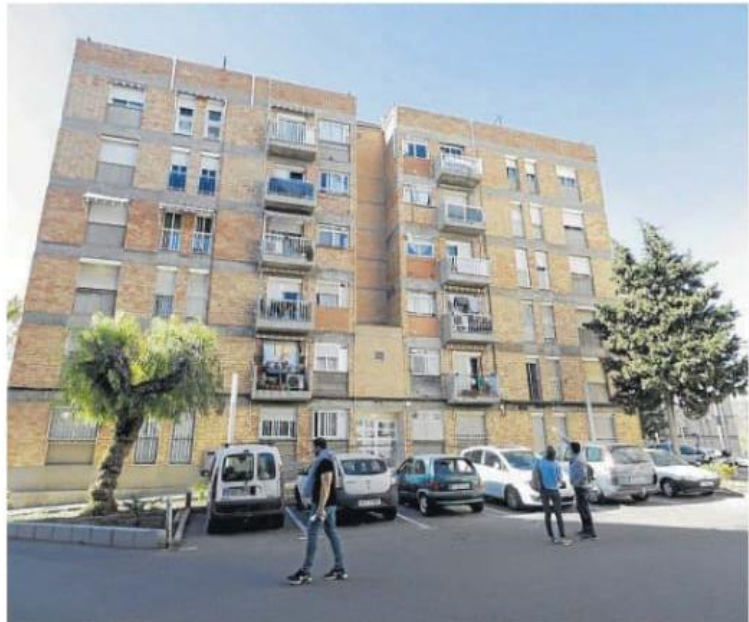
El edificio Castañé de La Floresta ha impulsado los trámites para la subvención.

La comunidad de propietarios ha contado con la ayuda de la asesoría Social House, lo que les ha permitido ir abordando cada uno de los pasos, empezando por la tramitación de la Inspección Técnica de Edificios (ITE). «Cuesta entender que la parte comunitaria también forma parte del piso», indica Peco, quien explica que «la mayoría de los vecinos son gente mayor, con unos ingresos escasos».