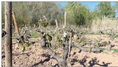
Imatge d'una vinya afectada.

Concretament, parlen de conreus com la vinya, que va afectar greument Sarral i Solivella a la Conca de Barberà, així com