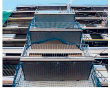
Fotografia d'arxiu d'un edifici en obres.

eficàcia de les campanyes informatives». Alhora, apunta que el seguiment del compliment fet pels ajuntaments «ha estat molt baix», destaca «que no s'ha imposat cap sanció a cap propietari» i que no s'han fet campanyes d'ajudes per finançar les inspeccions. Segons les xifres recollides pel Col·legi d'Aparelladors, Arquitectes Tècnics i Enginyers d'Edificació de Tarragona, a Torredembarra, Cunit o l'Hospitalet de l'Infant tan sols han passat l'ITE un 5% dels immobles que ho haurien d'haver fet.