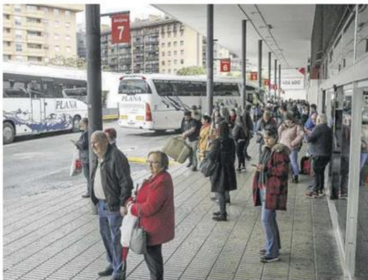
La mayoría de las conexiones con Barcelona son las que enlazan con el aeropuerto.

La Cambra de Tarragona lleva más de cinco años reivindicando que pueda implementarse, por parte del Departament de