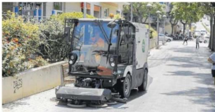
El actual contrato de la basura y la limpieza es del año 2002 y se prorrogó en 2010.

Los fondos podrán solicitarse hasta el 31 de diciembre de este de 2024 y dos años más tarde las obras deberán estar acabadas.