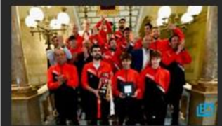
FOTOGALERÍAS Recepción oficial del Ayuntamiento de Tarragona al Club Voleibol Sant Pere i Sant Pau