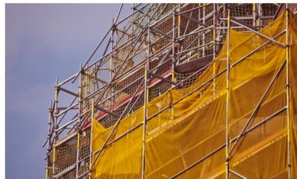
Imatge d'arxius d'una bastida en un edifici | Gerdia

Dels gairebé 120.000 edificis de les comarques de Tarragona que haurien d'haver passat la Inspecció Tècnica d'Edificis (ITE) d'ençà de la publicació del primer decret que en parla ara fa dotze anys, només l'han passat uns 24.000, un 20%. Segons el Col·legi d'Aparelladors i Arquitectes Tècnics de Tarragona (COATT), la situació és alarmant perquè l'estat de conservació dels parc immobiliari no és bo. Tot i que no passar la ITE pot comportar sancions importants, no se n'ha imposat cap i, per tot plegat, el COATT demana a l'administració que assumeixi el seu paper.