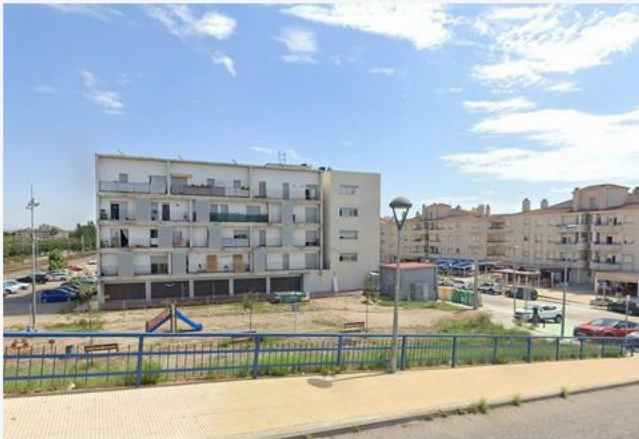
Edificis de Cunit a tocar de la via del tren. Es calcula que en aquest municipi només un 5% dels immobles han passat la ITE.