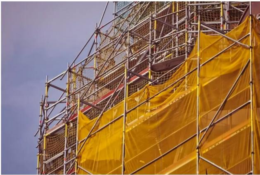
Imatge d'un edifici en rehabilitació

El col·legi d'aparelladors i arquitectes apunta que un 93% dels immobles revisats tenien deficiències