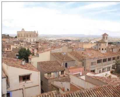
El COAATT insisteix en la necessitat de fer passar la ITE.

La inspecció tècnica d'edificis, creada el 2010