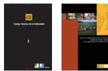
ACTUALIZACIÓN CTE y PG-3

De PREMETI destacar las siguientes novedades: